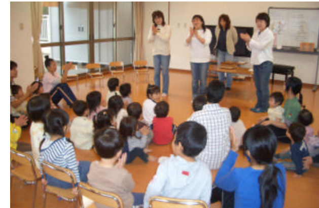
[6/9(金)「ひなたぼっこの会」による絵本読み聞かせより]

今回は、9月29日(金)「ひなたぼっこの会」の方の読み聞かせを楽しみにしていただきます。