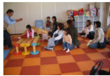
[阿部先生による手品]